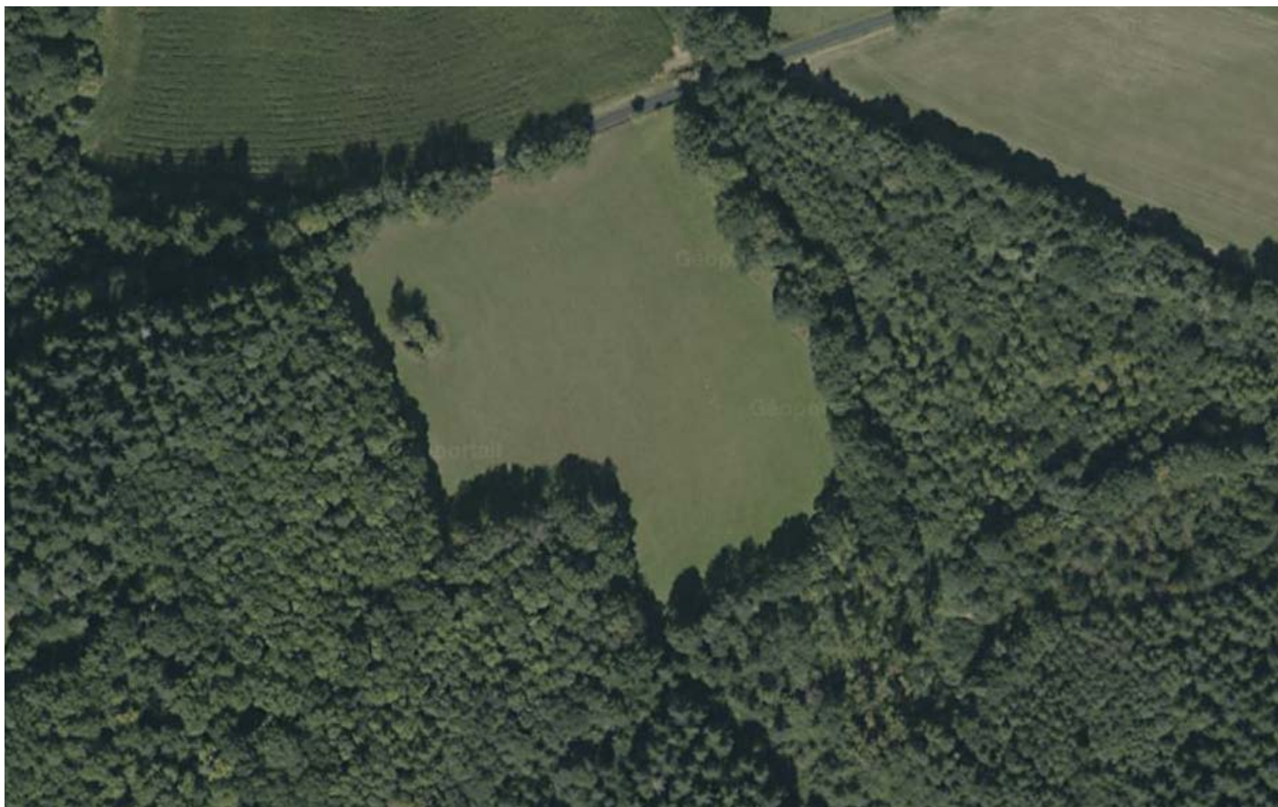
Le pont de la Dame

PÂTURAGE À VACHES ET PRÉ À FOIN / 2,5 HA