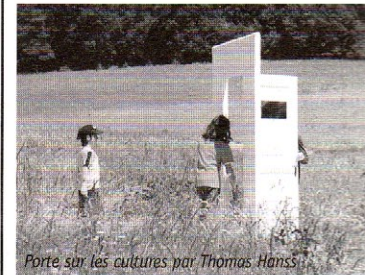
Porte sur les cultures par Thomas Hanss