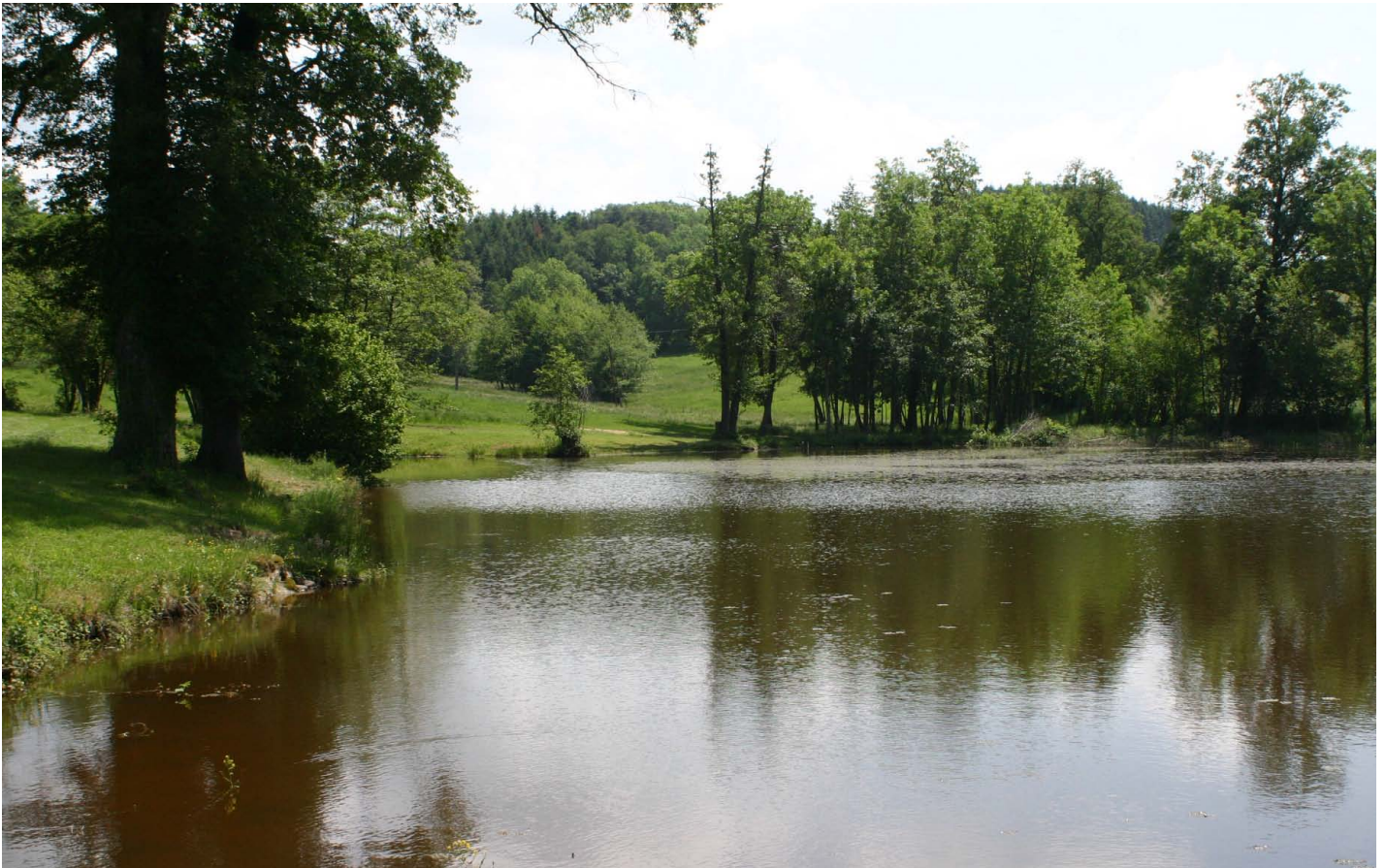
Vue sur l'étang depuis la route communale

L'étang occupe une position centrale sur l'exploitation, accessible directement depuis la route communale. Il est bordé par des pâturages à vaches.