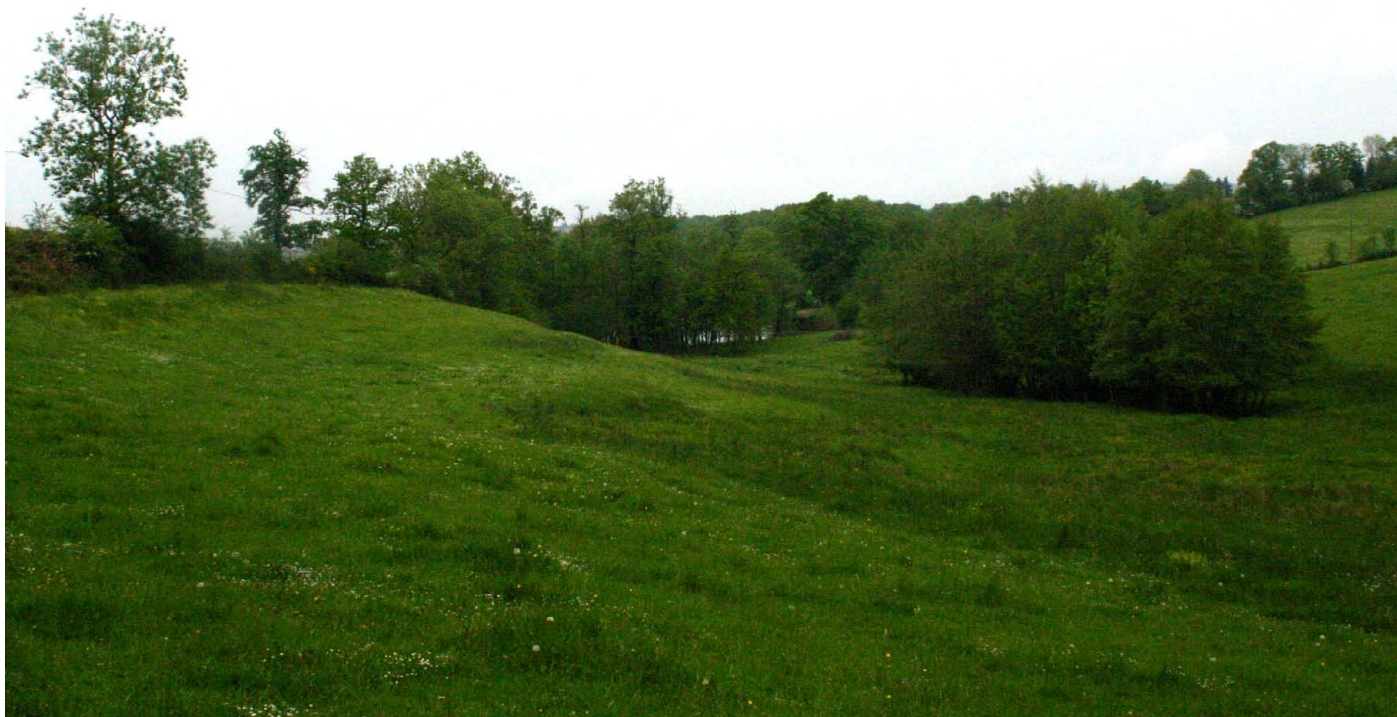
Le pré de Brun au printemps

PÂTURAGE À VACHES DE FOND DE VALLÉE / 4 HA