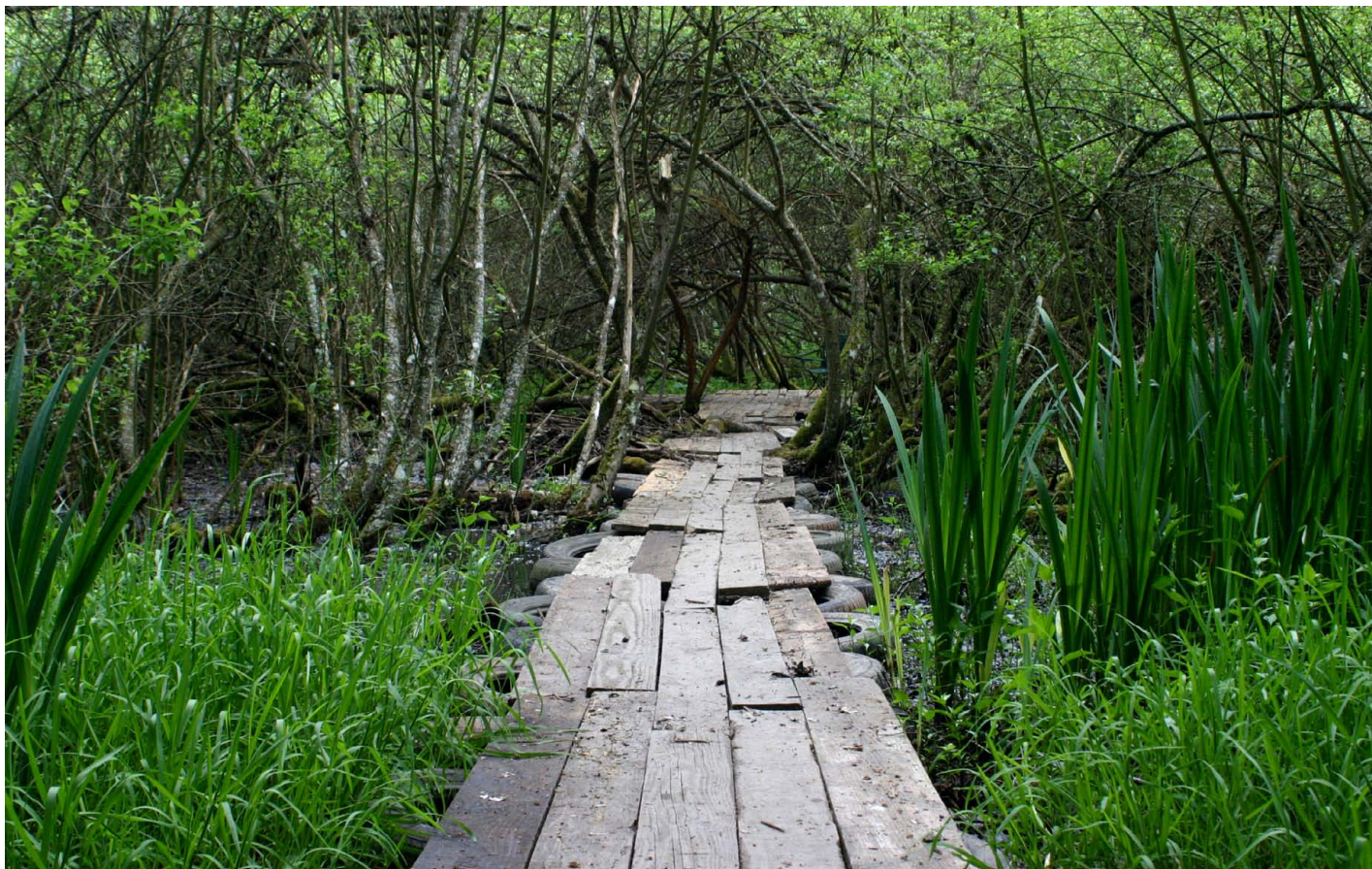
Vue sur le passage en planches de bardage récupéré sur pneus

L'étang envasé correspond à un ancien étang de fond de vallée qui s'est progressivement comblé puis boisé. On retrouve ainsi dans sa partie arrière (l'ancienne queue de l'étang) un espace actuellement en partie enherbé occupé par des aulnes de grande dimension. La partie centrale est boisée par des saules plus ou moins tortueux. Enfin la partie la plus proche de la digue, régulièrement submergée lors des période d'inondation, est plantée d'espèces aquatiques (iris des marais, prêle, sagittaires, etc.).